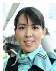
株式会社日本レストランエンタプライズ アドバイザー