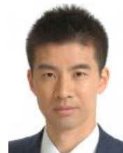
デロイト トーマツ コンサルティング株式会社 シニアマネジャー

（2013年6月時点で40万部を売り上げ、2013年ビジネス書大賞書店賞、第4回オーディオブックアワード審査員特別賞を受賞。2013年ビジネス書大賞書店賞、第4回オーディオブックアワード審査員特別賞を受賞）