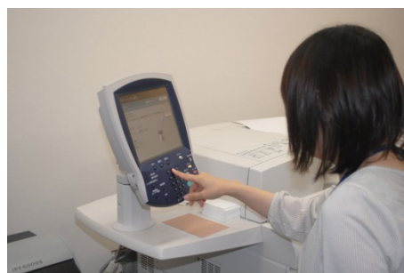
在宅雇用の社員がデザインした制作物をオフィスにあるオンデマンド印刷機 700 Digital Color Pressで出力、その特性を最大限に活かし、印刷業務をさらに拡大中