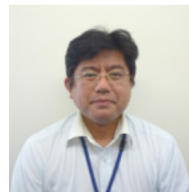
クオールアシスト株式会社 取締役

そのような方々に、クオールアシストは、一層の障がい者雇用の機会創出に努め、新しい業務に積極的に挑戦し、スキルを高める環境を整えていきます。