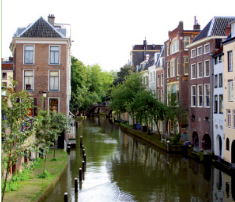
ユトレヒト職業大学 様

「このプロジェクトは、全体的に成功しています。人材、スペース、無駄な出力原稿、必要のない著作権の支払いに対する事前投資という点で、大幅な削減を実現しています」