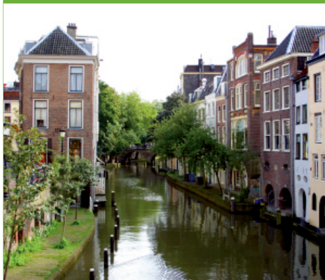
ユトレヒト職業大学 様

「このプロジェクトは、全体的に成功しています。人材、スペース、無駄な出力原稿、必要のない著作権の支払いに対する事前投資という点で、大幅な削減を実現しています」